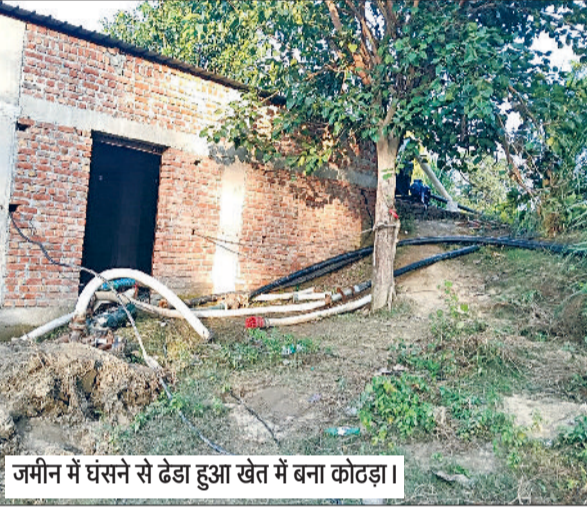
जमीन में घंसे से ढेड़ा हुआ खेत में बना कोटड़ा।

गोहाना क्षेत्र के जुआं गांव में लगातार हो रही भारी बारिश ने किसानों की मेहनत पर पानी फेर दिया। गांव के खेतों में 5 से 6 फीट तक पानी भर गया, जिससे सैकड़ों एकड़ में खड़ी फसलें पूरी तरह नष्ट हो गईं। अनुमान के अनुसार, गांव की लगभग 70 प्रतिशत फसलें पूरी तरह खराब हो चुकी हैं। बर्बाद हुई फसलों में मुख्य रूप से धान, ज्वार और विभिन्न प्रकार की सब्जियों की फसलें