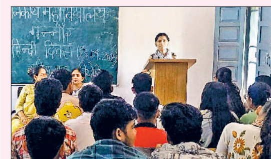
गन्नौर। हिंदी दिवस कार्यक्रम पर अपने विचार प्रस्तुत करती छात्रा।

कहा कि भारत दुनिया में सबसे ज्यादा विविध संस्कृतियों वाला देश है। धर्म, परंपराओं और भाषा में इसकी विविधता के बावजूद यहां के लोग एकता में विश्वास रखते हैं। हिंदी भारत की प्रमुख भाषा है जो दुनियाभर में तीसरी सबसे अधिक बोली जाने वाली भाषा है। यह दुनियाभर के भारतीयों को भावनात्मक रूप से एक साथ जोड़ने का काम करती है। इसे बढ़ावा देना और संरक्षित करना हमारा कर्तव्य है।