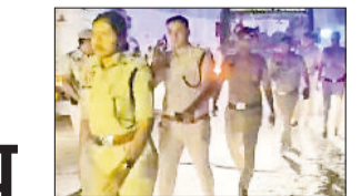
पैदल गश्त से बढ़ता है जनता का विश्वास