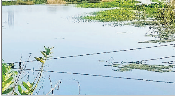
सोनीपत। खेतों में भरा बरसात का पानी व निकासी के लिए लगाए मोटर पंप।