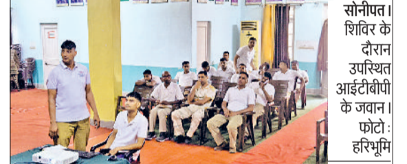
सोनीपत। शिविर के दौरान उपस्थित आईटीबीपी के जवान।