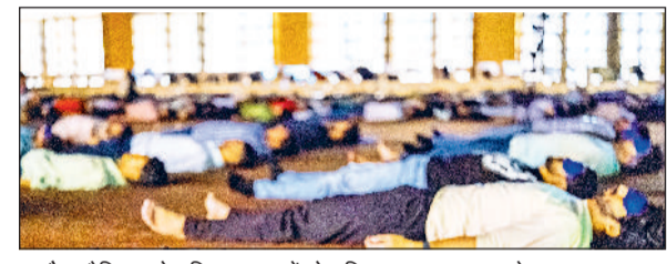
गन्नौर। वैश्विक योग निद्रा उत्सव में योग निद्रा का अभ्यास करते साधक।